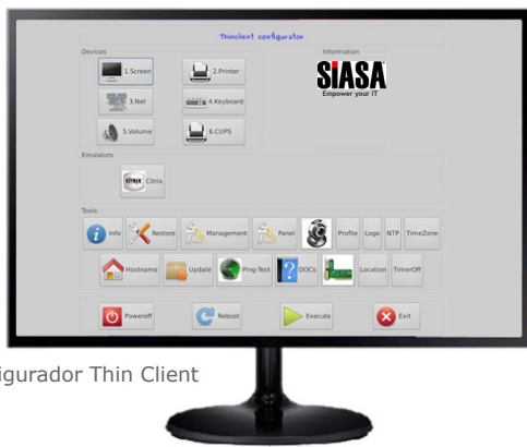
Configurador Thin Client