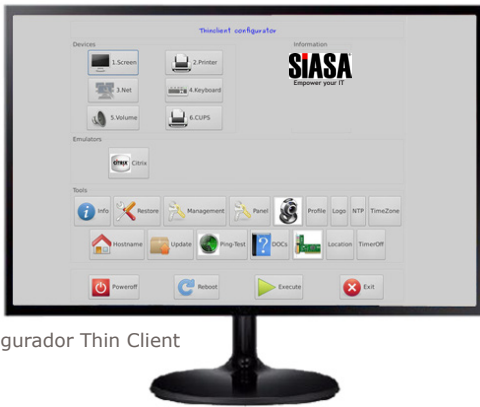
Configurador Thin Client